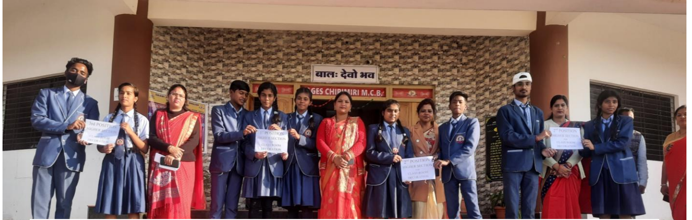
Class teacher and class monitors appreciated for the decoration of the classroom.